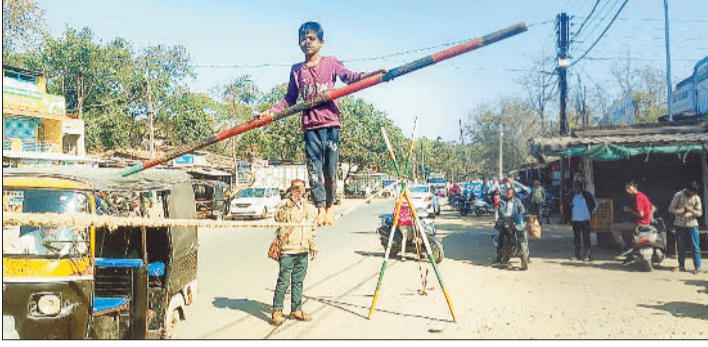
रस्सी पर चलकर करतब दिखाता बालक।

इसी तरह नजारा रविवार को शहर के पुराने बस स्टैंड के पास सड़क किनारे देखने को मिला, जहां एक मासूम बालक परिवार के भरण-पोषण की खातिर 5 फीट ऊंची रस्सी में जिंदगी का संतुलन बनाने दिखा, जिसके करतब को देखकर लोग दांतों तले उंगली दबाते रहे और लोग तालियां बजाते रहे, लेकिन मासूम बच्चे के चेहरे पर कोई मुस्कान नहीं थी। करतब दिखाने के बाद बच्चा थाली लेकर लोगों के सामने याचना के लिए थाली आगे बढ़ाया तो कई लोगों ने