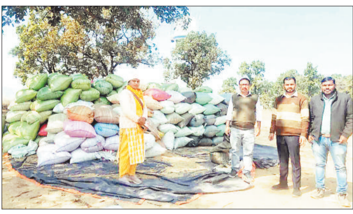
अवैध धान भण्डार पर कार्रवाई करते अधिकारी।